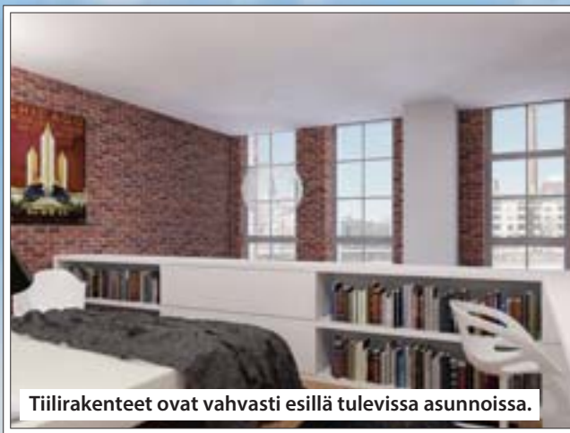
Tiilirakenteet ovat vahvasti esillä tulevissa asunnoissa.