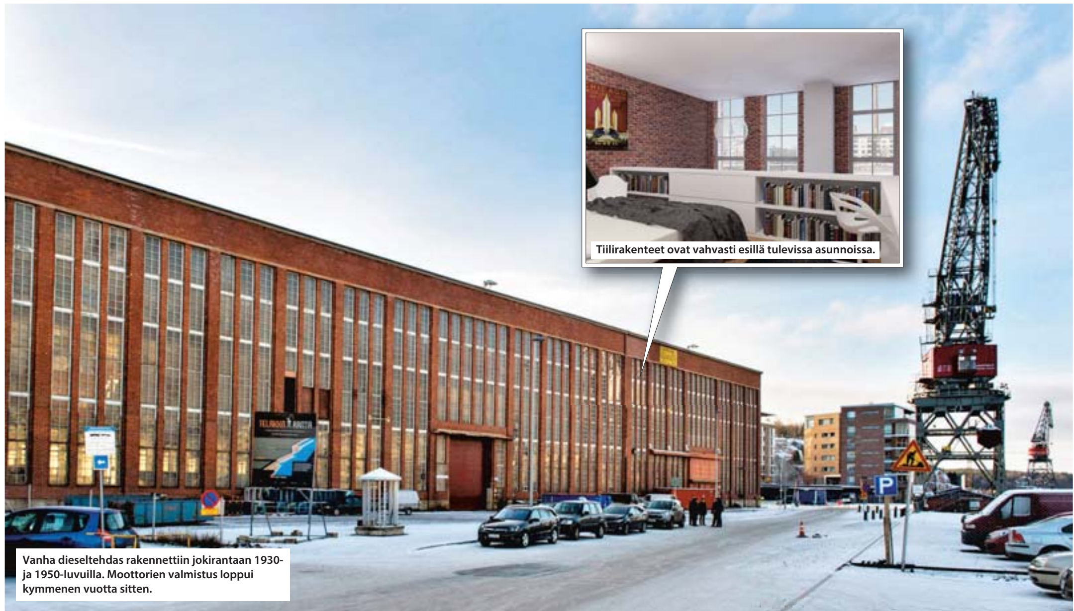
Vanha dieseltehdas rakennettiin jokirantaan 1930- ja 1950-luvuilla. Moottorien valmistus loppui kymmenen vuotta sitten.

Havainnekuviusta selviää, että tiilipinta on esillä myös asuntojen sisällä. Ikkunat ovat korkeita ja kapeita. Kaksi kolmasosa tulevista asunnoista antaa jokimaiseman suuntaan.