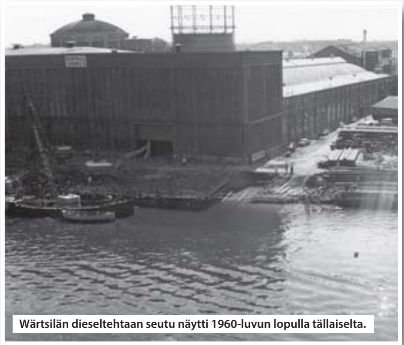
Wärtsilän dieseltehtaan seutu näytti 1960-luvun lopulla tällaiselta.

TS/S.L. valokuva: Jari Laurikko, havainnekuva: Arkkitehtitoimisto Haroma & partners